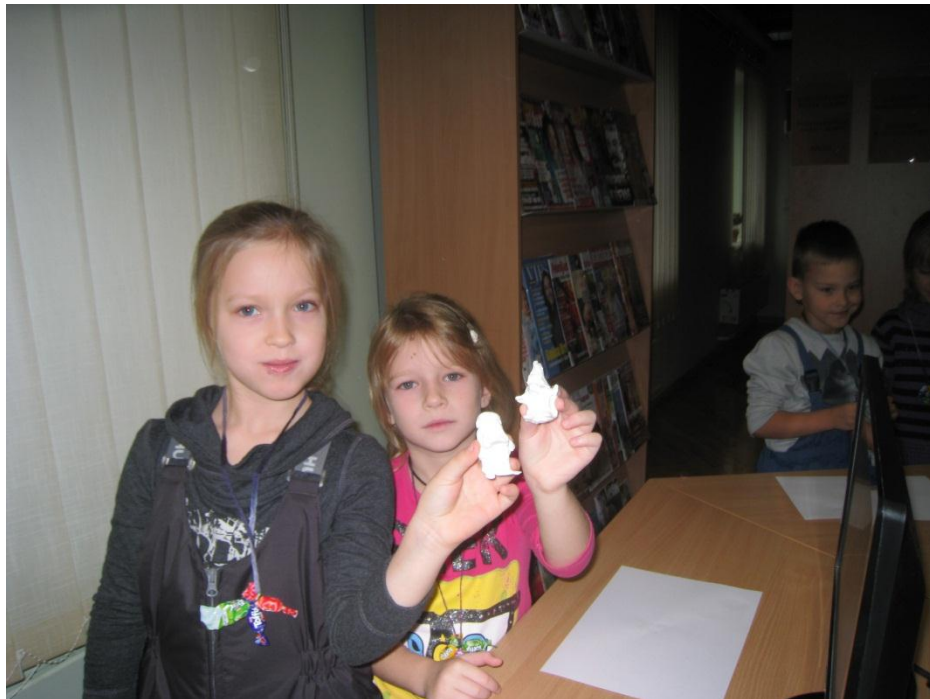
Šie ir bērnu veidotie trollīši Ziemeļvalstu nedēļas lasīšanas pasākumā.