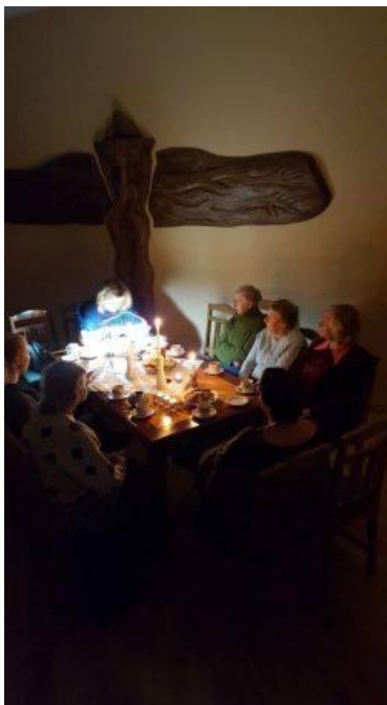
Ziemeļvalstu nedēļai veltīts pasākums pieaugušo auditorijai.